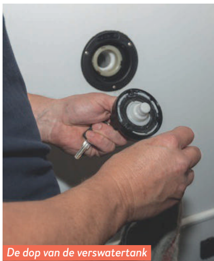
De dop van de verswatertank laat zich lastig verwijderen.