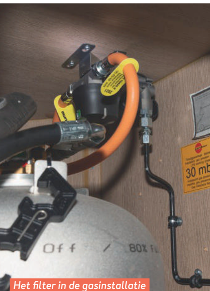
Het filter in de gasinstallatie zit niet op de juiste plek.