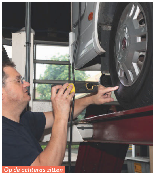
Op de achteras zitten banden van een dubieus merk.