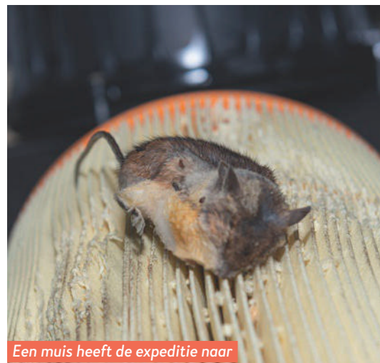
Een muis heeft de expeditie naar het luchtfilterhuis niet overleefd.

bedient. Smits: "Hartstikke onhandig. Ik snap ook niet waarom dat zo is aangelegd. Er is maar één kabeltje nodig om te zorgen dat de camera aanspringt als je de achteruit inschakelt." Het cameraatje staat bovendien zo afgesteld dat fiet-sendrager en fiets buiten beeld vallen. Ook niet handig. En al helemaal niet als je geen bijrijder hebt om even buiten de wagen mee te kijken.