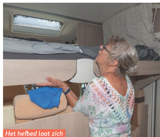
Het hefbed laat zich moeilijk omhoog bewegen.

lampen branden, hetgeen wettelijk niet mag en afkeur voor de apk had moeten opleveren.