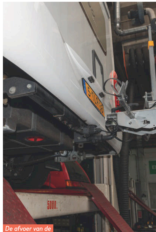
De afvoer van de vuilwatertank lekt.

Maar bij al dat nakijken van de dealer had zoets opgemerkt moeten worden. Evenals de onderste sluiting van het gasluik, die ook nauwelijks te openen is. En de 'allesnakijker' is het ook ontgaan dat de aansluiting van de afvoerpijp op