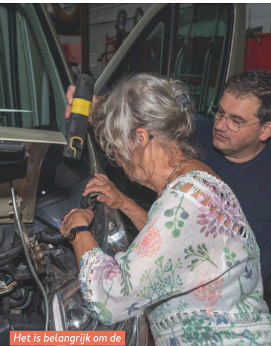
Het is belangrijk om de afvoergaatjes open te houden.