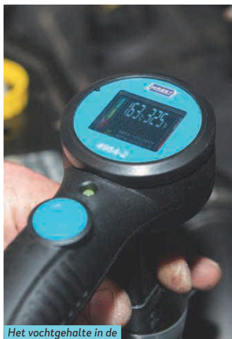
Het vochtgehalte in de remvloeistof zit tegen de grens.