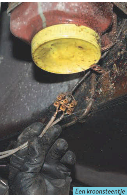
Een kroonsteentje bezorgt de keurmeester rillingen.