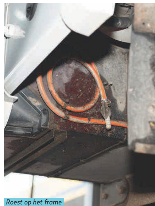
Roest op het frame van de afvalwatertank.

op de achterwielen zwaar aangetaste remblokken ontwaart. “Die zijn veel te heet geweest”, weet hij en hij adviseert vernieuwing bij de eerstvolgende beurt. Dan dient ook de remvloeistof vervan-