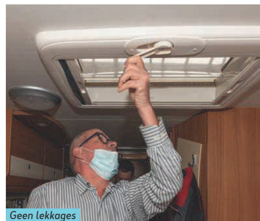
Geen lekkages in het interieur.

schoonwatertank te maken te hebben. Ondanks een wirwar van slangen heeft nummer twee geen verbinding met het interieur. Een opgerolde slang met een kraantje achter de achterbumper doet vermoeden dat uit deze tweede tank een gieter gevuld werd. Smits' werklamp belicht ook iets elektrisch: een kabeltje met kroonsteentjes. De rillingen lopen de keurmeester over de rug. “Ik zou dat hele spul weghalen. Scheelt ook in gewicht.” De tweede watertank lost het raadsel op dat de Carado boven op zijn linker achterlichtunit meedraagt, een pijpje met een kurk erin. “Zou er een vlaggetje in gezeten hebben?” vroeg Smits zich eerder af. Maar het blijkt de vulopening voor de verstopte watertank te zijn.