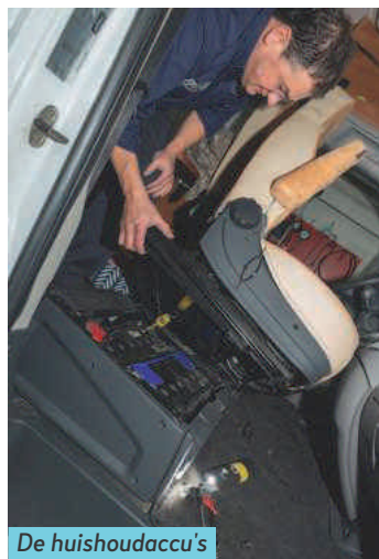
De huishoudaccu's zijn in prima conditie.