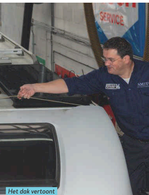
Het dak vertoont aangetaste kitnaden.