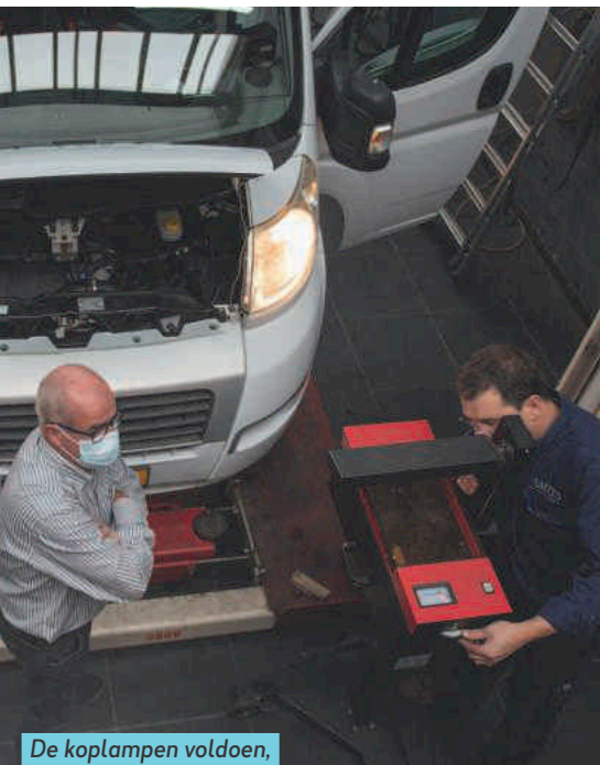
De koplampen voldoen, maar ze zijn wel dof.