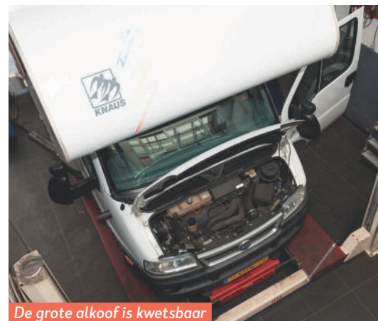
De grote alkoof is kwetsbaar voor takken en rotspartijen.