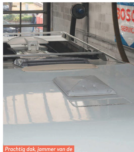
Prachtig dak, jammer van de antenne helemaal achteraan.