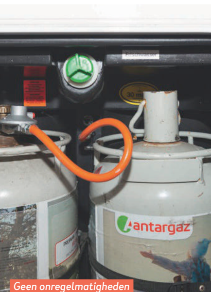
Geen onregelmatigheden in de gaskast.