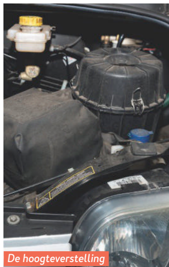
De hoogtevinstelling van de koplamp is kapot.