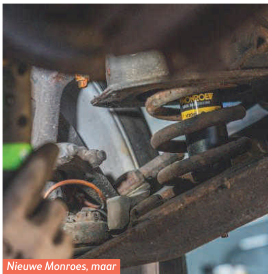
Nieuwe Monroes, maar veel te licht uitgevoerd.