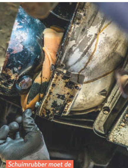
Schuimrubber moet de gelekte olie absorberen.