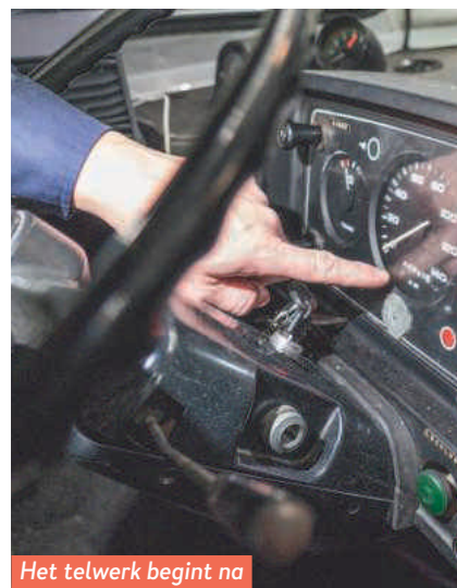
Het telwerk begint na 99.999 kilometer opnieuw.