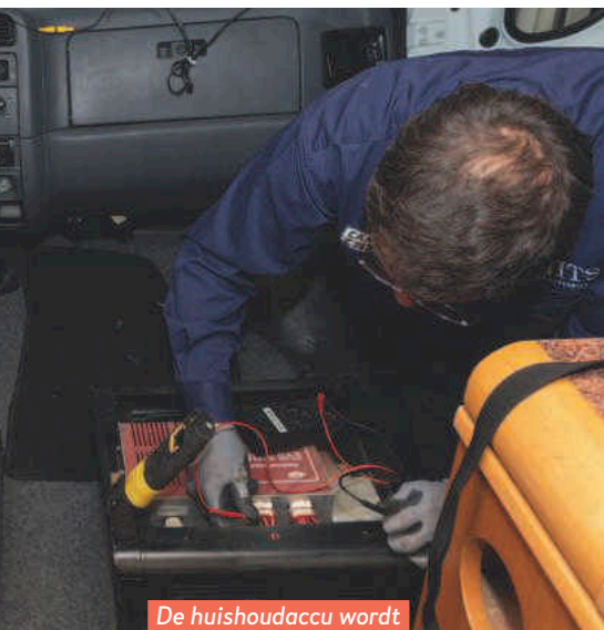
De huishoudaccu wordt niet geladen op netspanning.