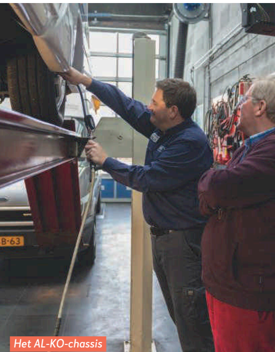
Het AL-KO-chassis is nog in prima staat.