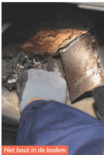
Het hout in de bodem is aan het rotten geslagen.