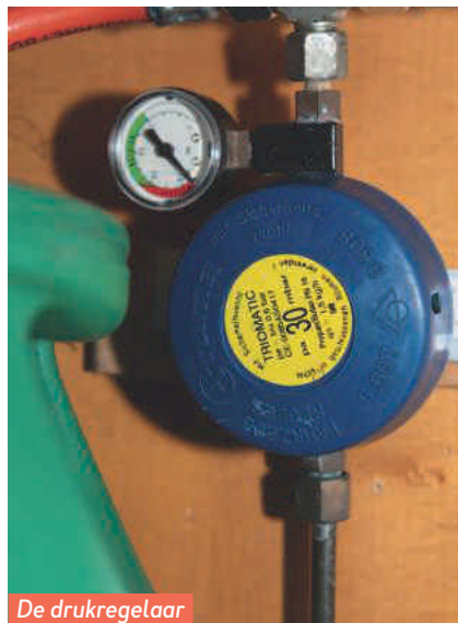
De drukregelaar is hoogbejaard.