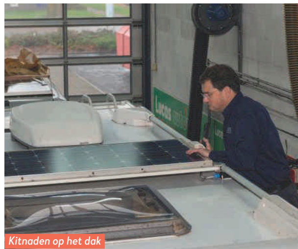
Kitnaden op het dak zijn aan vervanging toe.

oude Fiat Ducato, basis voor deze Fendt, is dat stuk blik weggerot of zwaar aangetast door roest. Hier niet. Een glimmend zwarte laklaag laat zien dat de balk onlangs al vervangen is.