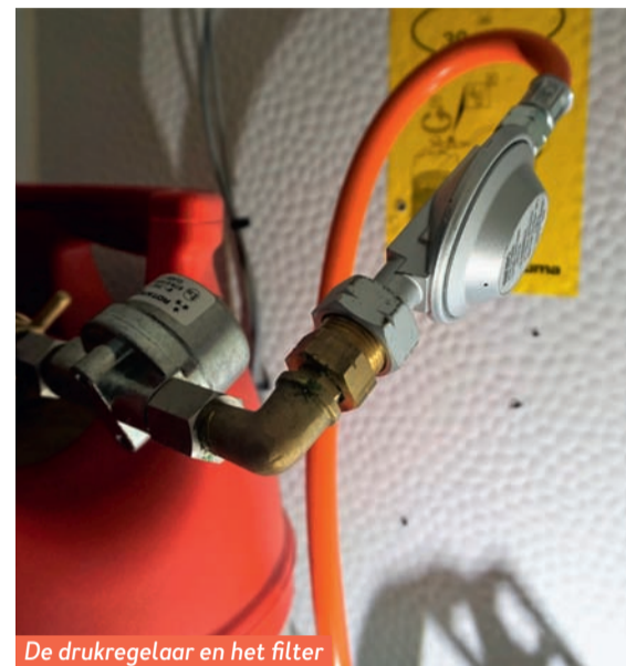
De drukregelaar en het filter moeten worden vervangen.

tegenvaller. Smits kan 'm niet uitlezen. Dat is geen ramp, maar bij de volgende apk moet de wagen daarom aan de roetmeter.