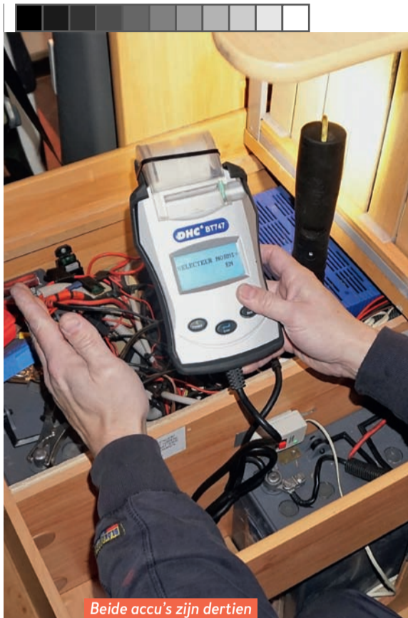
Beide accu's zijn dertien jaar oud en aan vervanging toe.