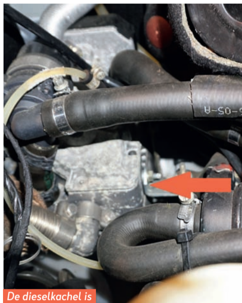
De dieselkachel is later ingebouwd.