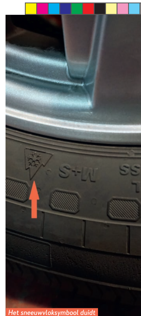
Het sneeuwvloksymbool duidt erop dat dit een winterband is.