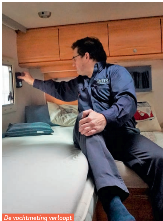
De vochtmeting verloopt vlekkeloos: overal droog.