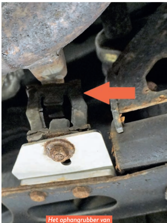
Het ophangrubber van de uitlaat is verdroogd.