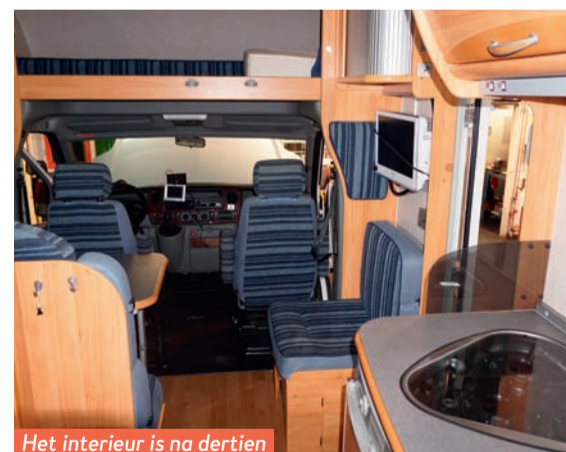
Het interieur is na dertien jaar nog altijd keurig.