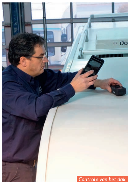
Controle van het dak.