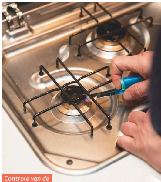
Controle van de gaspitsbeveiliging.