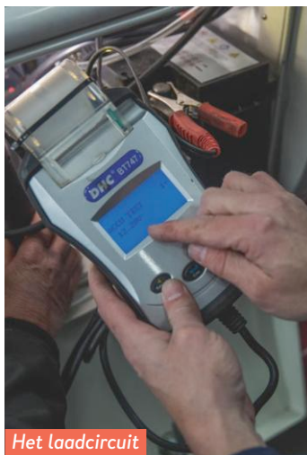
Het laadcircuit functioneert niet goed.