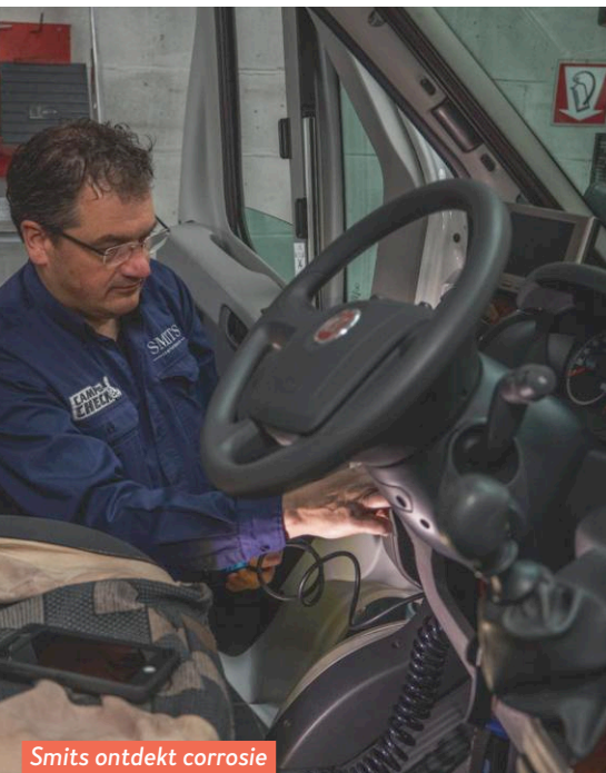
Smits ontdekt corrosie op een printplaat.