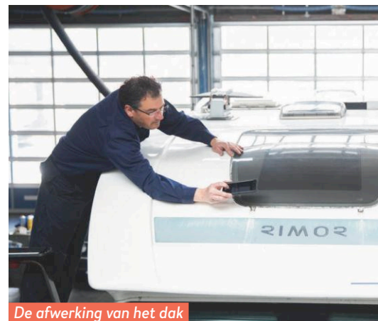
De afwerking van het dak heeft aandacht nodig.