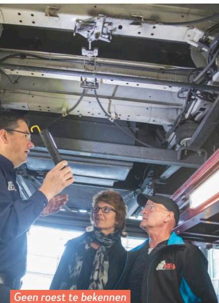
Geen roest te bekennen aan het chassis.