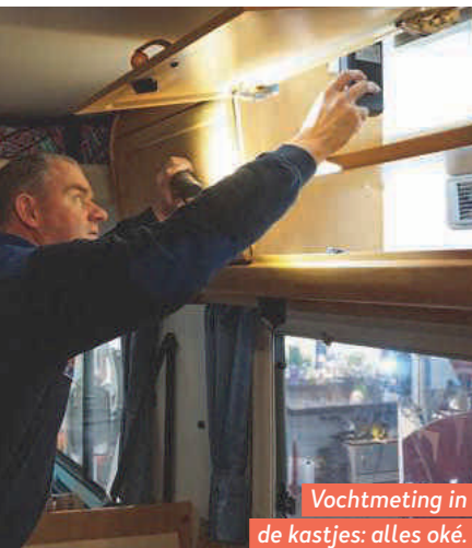
Vochtmeting in de kastjes: alles oké.