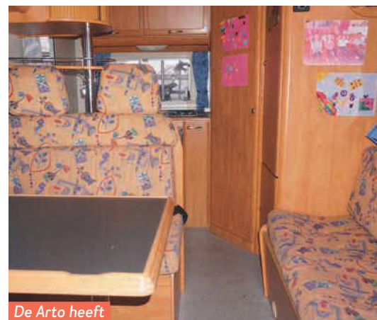
De Arto heeft een kleurrijk interieur.