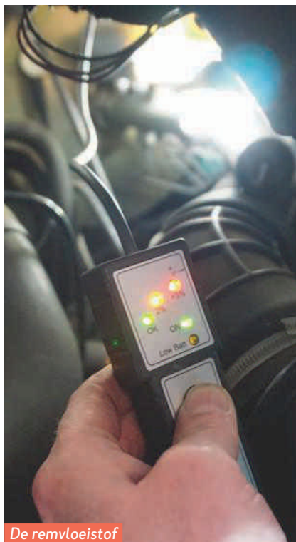
De remvloeistof bevat te veel vocht.