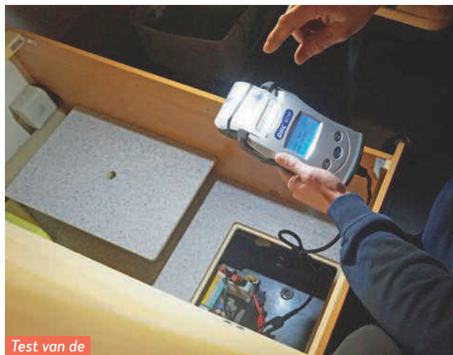
Test van de huishoudaccu.