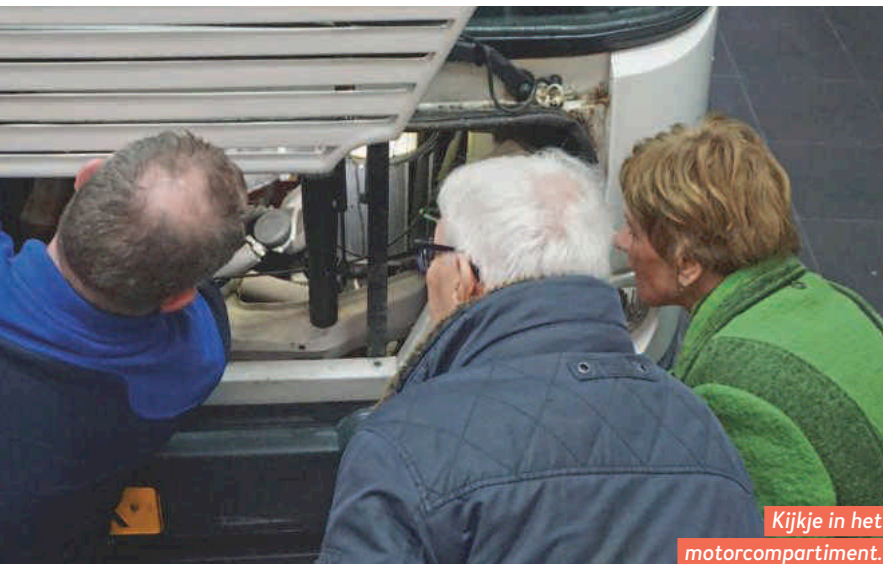
Kijkje in het motorcompartiment.