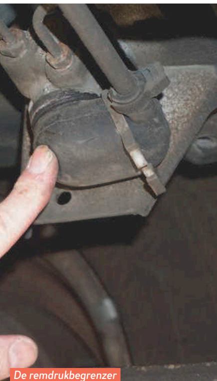
De remdrukbe­grenzer zorgt voor variabele remkracht.