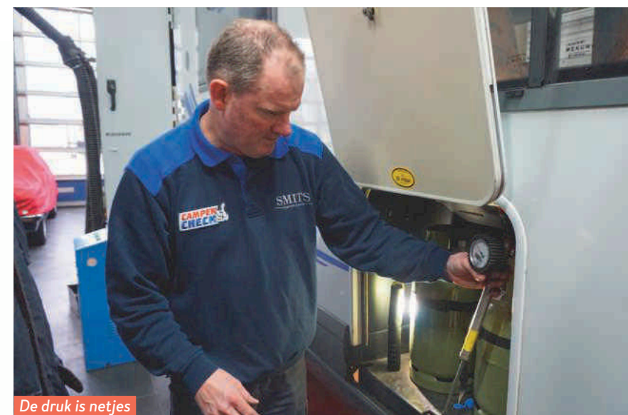
De druk is netjes op niveau gebleven.