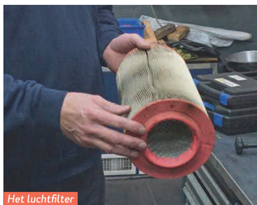
Het luchtfilter is aan vervanging toe.

het opladen ontstaat het zeer explosieve knalgas, dat afgevoerd moet worden. Na de keuring wordt dit slangetje alsnog aangebracht.