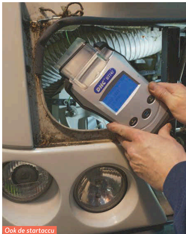
Ook de startaccu blijkt nog in goede staat.