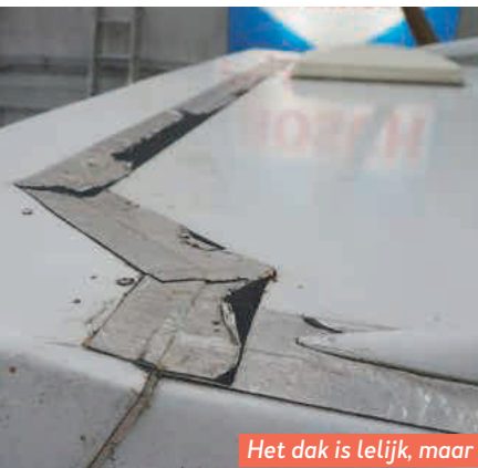
Het dak is lelijk, maar effectief gerepareerd.