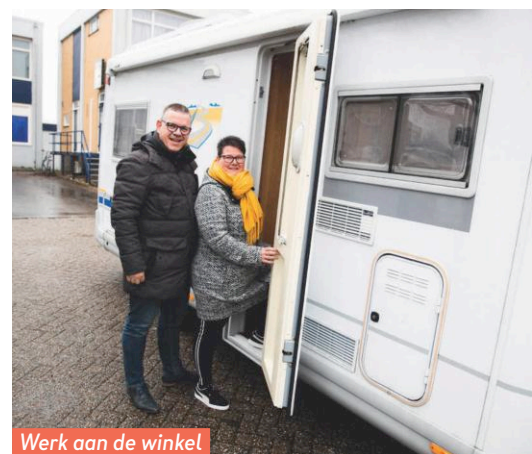
Werk aan de winkel voor de eigenaren.