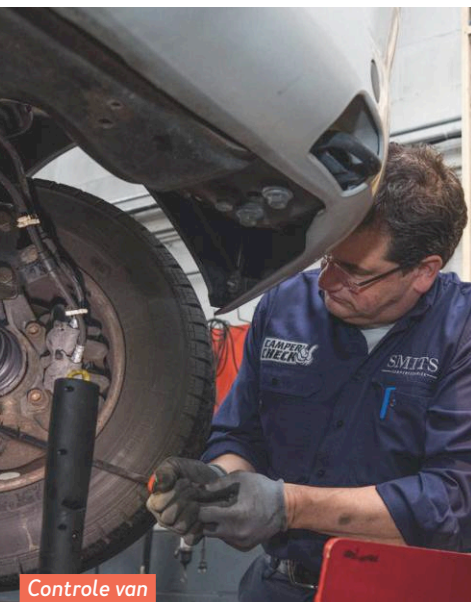
Controle van de fuseekogel.