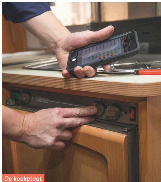
De kookplaat heeft slechte branders.