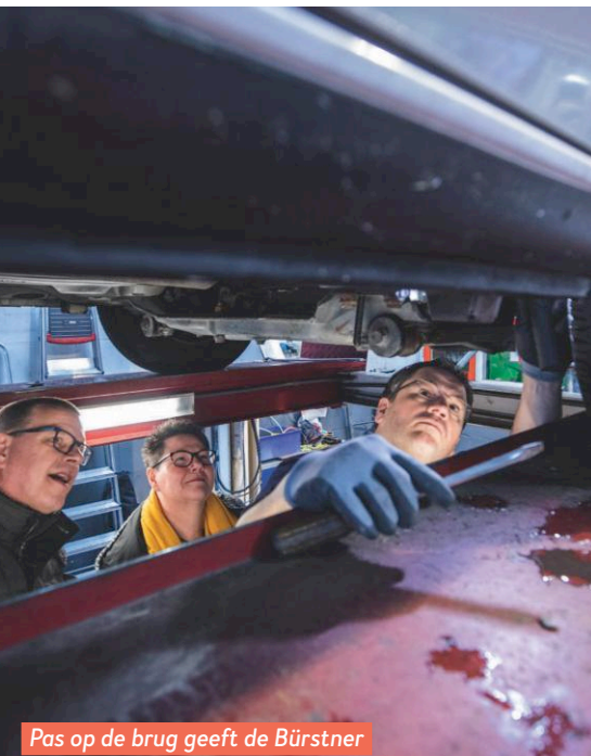
Pas op de brug geeft de Bürstner zijn smerige geheim prijs.