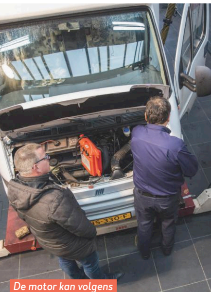
De motor kan volgens Smits nog zeker een ton mee.