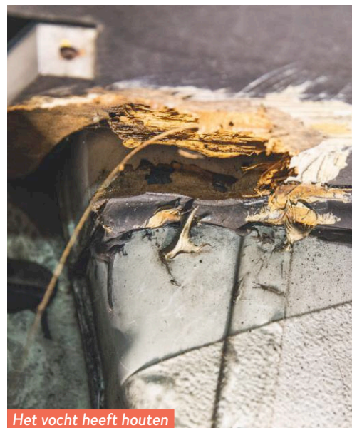
Het vocht heeft houten delen in pulp veranderd.