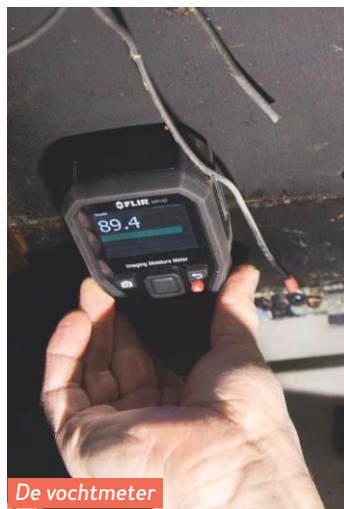
De vochtmeter kent geen genade.