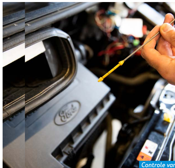
Controle van het oliepeil.