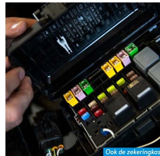
Ook de zekeringkast wordt geïnspecteerd.