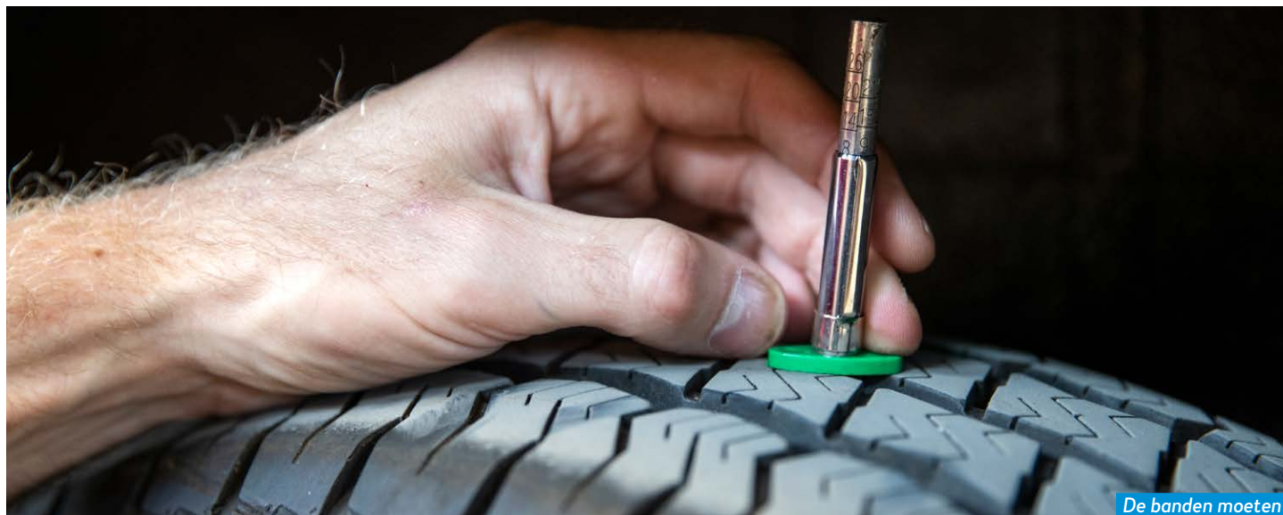
De banden moeten voldoende profiel hebben.