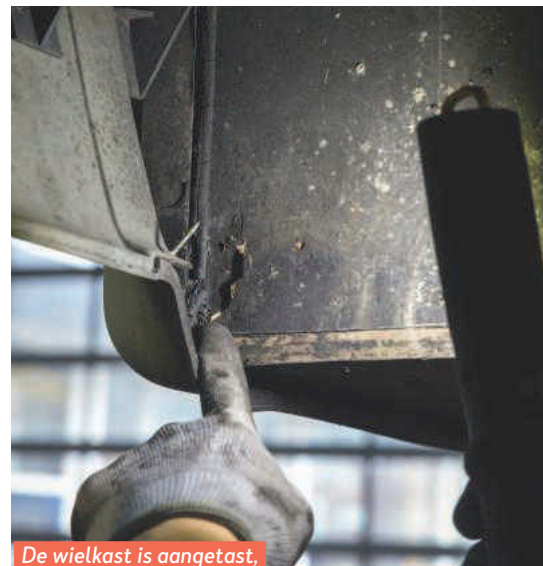
De wielkast is aangetast, maar nog wel goed te redden.