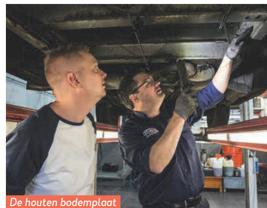
De houten bodemplaat is nog in redelijke staat.