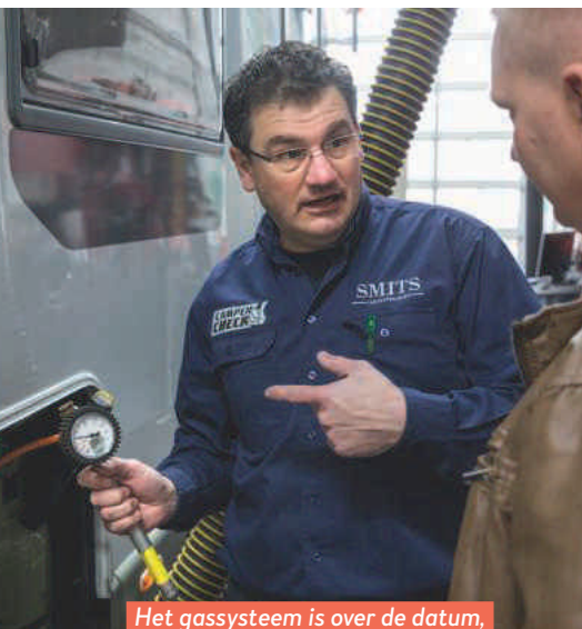
Het gassysteem is over de datum, maar de zaak blijft wel netjes op druk.