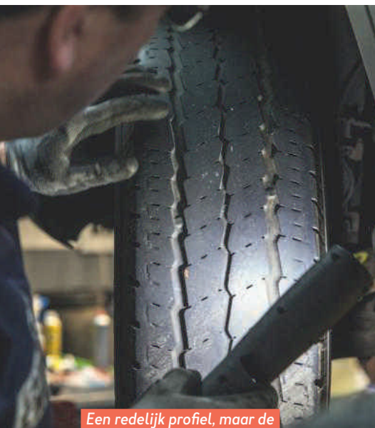
Een redelijk profiel, maar de banden zijn hoogbejaard.