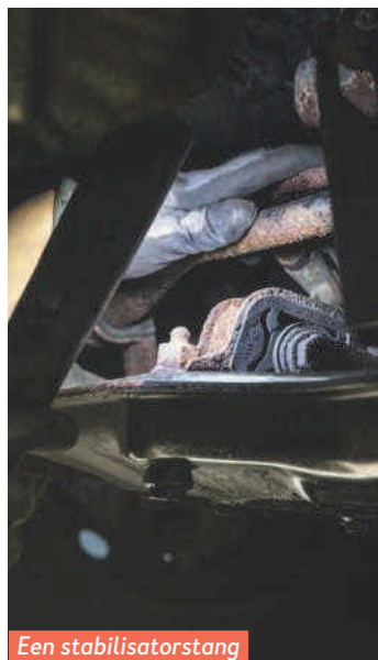
Een stabilisatorstang is flink door roest aangetast.