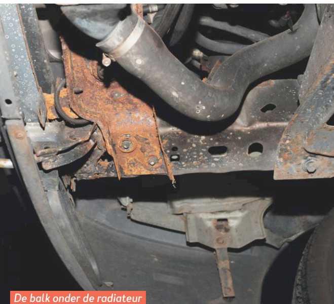
De balk onder de radiator is flink aangetast door roest.