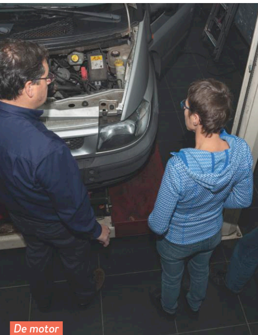
De motor loopt prima.