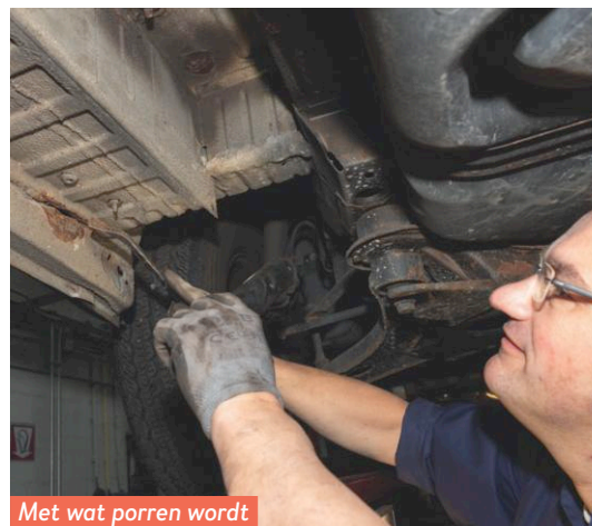
Met wat porren wordt er flink wat roest zichtbaar.

trouwe bondgenoot laten keuren. “Hij is veertien jaar oud, we weten dat er een paar dingetjes moeten worden aangepakt, maar wij willen ook weten hoe hij er verder bij staat”, licht Peter de Bruijne toe. Ze worden op hun wenken bediend. Navraag bij bouwer Burow leert overigens dat het ooit de bedoeling was om de camper in serieproductie te nemen, maar dat het door omstandigheden bij één exemplaar is gebleven. Inderdaad echt uniek dus.