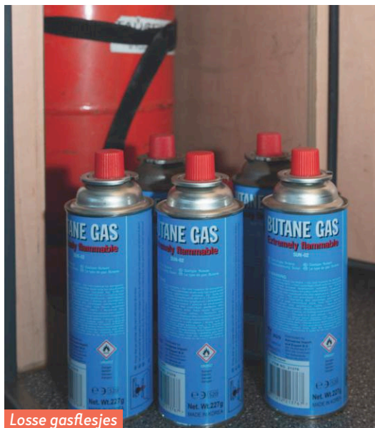
Losse gasflesjes mogen niet in de gasbun staan.