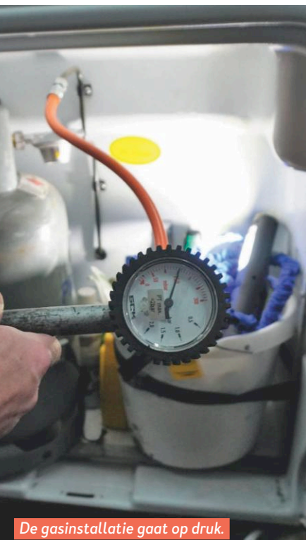
De gasinstallatie gaat op druk.