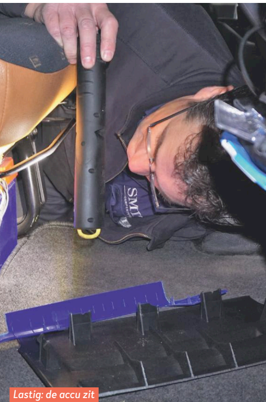
Lastig: de accu zit onder de stoel.