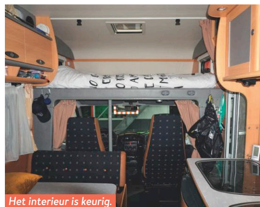
Het interieur is keurig.