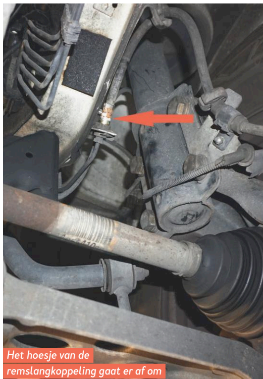
Het hoesje van de remslangkoppeling gaat er af om roestvorming te voorkomen.