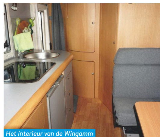
Het interieur van de Wingamm is netjes en verrassend ruim.