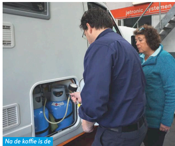
Na de koffie is de druk nog steeds 150 millibar.

de bijrijderstoel heeft vervangen door een multifunctionele kist. Tijd om de motorkap te openen en daar de boel te bekijken. Brandschoon! Stork: "Ja, die heb ik deze week nog helemaal schoongemaakt en gepoetst." De keur-