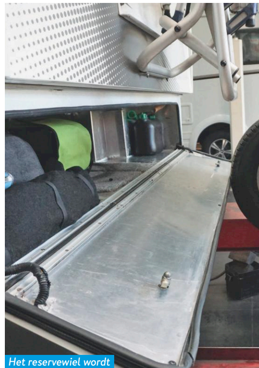
Het reservewiel wordt ook op spanning gebracht.