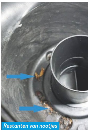
Restanten van nootjes in de luchtfilterruimte.