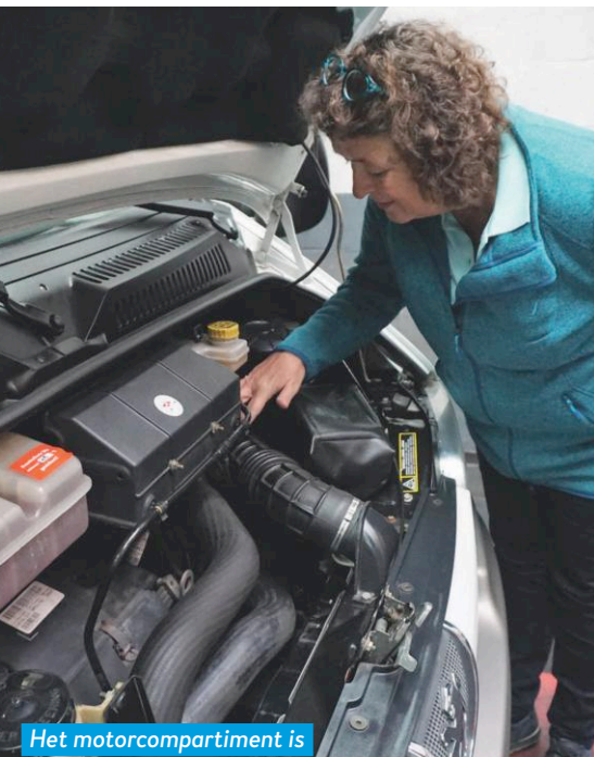
Het motorcompartiment is blinkend schoon.