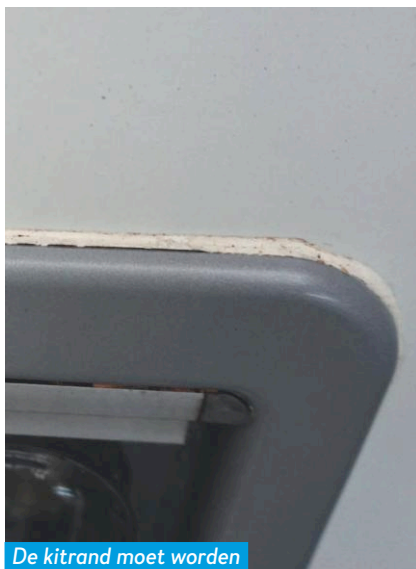
De kitrand moet worden aangepakt voordat het misgaat.