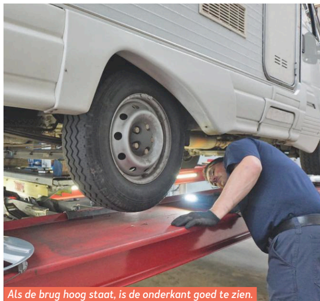
Als de brug hoog staat, is de onderkant goed te zien. Die blijkt supergaaf.