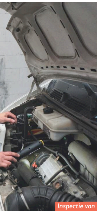
Inspectie van het motorblok.