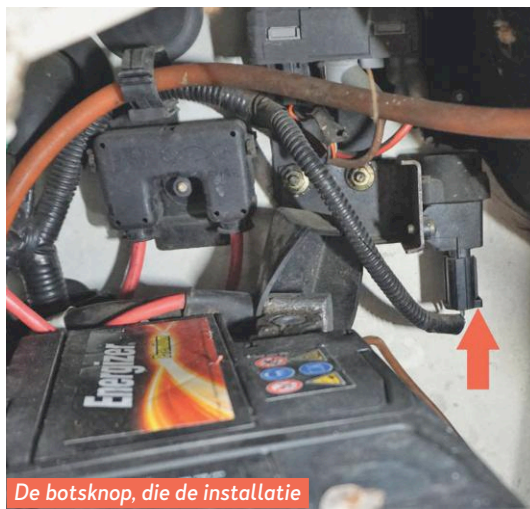
De botsknop, die de installatie uitschakelt bij een harde klap.