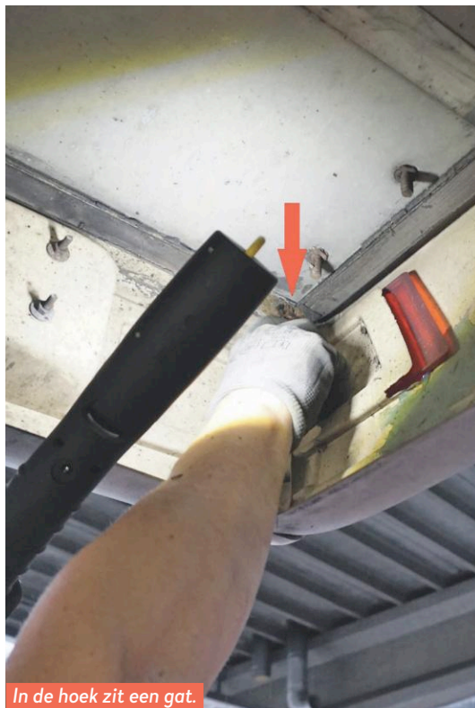
In de hoek zit een gat.