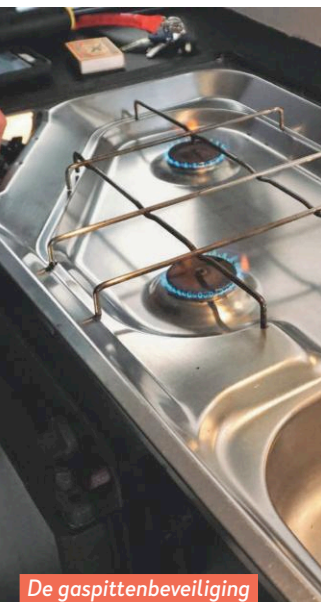
De gaspittenbeveiliging werkt naar behoren.