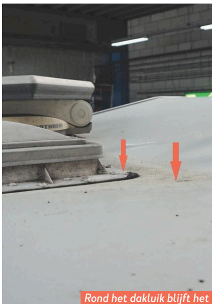
Rond het dakluik blijft het water op het dak staan.