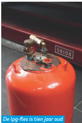
De lpg-fles is tien jaar oud en moet worden gekeurd.