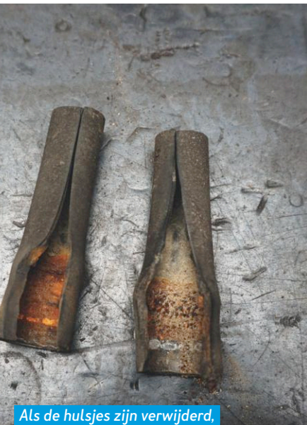
Als de hulsjes zijn verwijderd, is de roest duidelijk te zien.