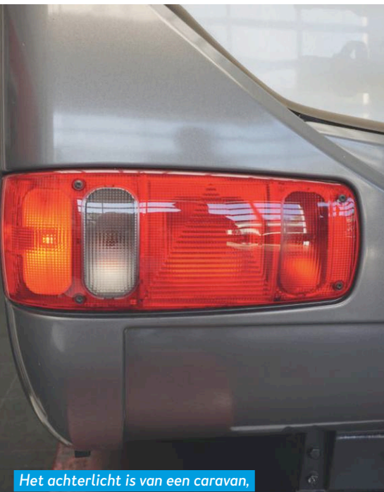
Het achterlicht is van een caravan, te zien aan de reflectordriehoek.