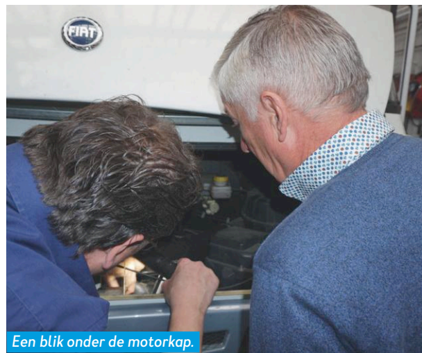
Een blik onder de motorkap.

heeft een geïntegreerde driehoek en dat is wettelijk niet toegestaan.”