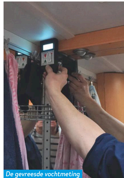
De gevreesde vochtmeting verloopt vlekkeloos.