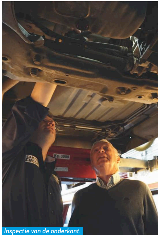
Inspectie van de onderkant.