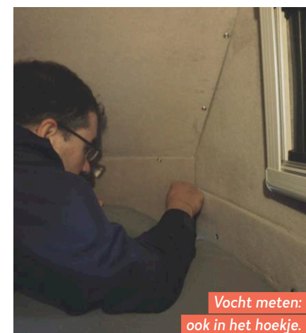
Vocht meten: ook in het hoekje.