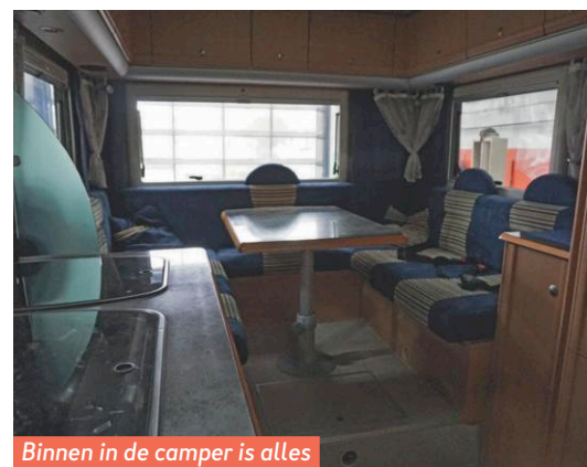
Binnen in de camper is alles spic en span.