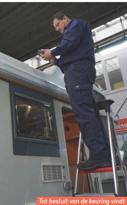
Tot besluit van de keuring vindt de inspectie van het dak plaats.