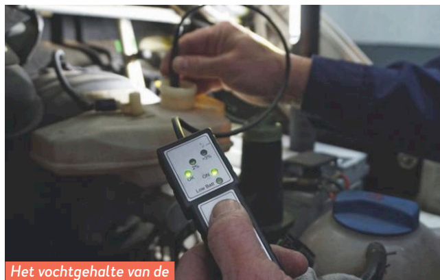
Het vochtgehalte van de remvloeistof is niet te hoog.