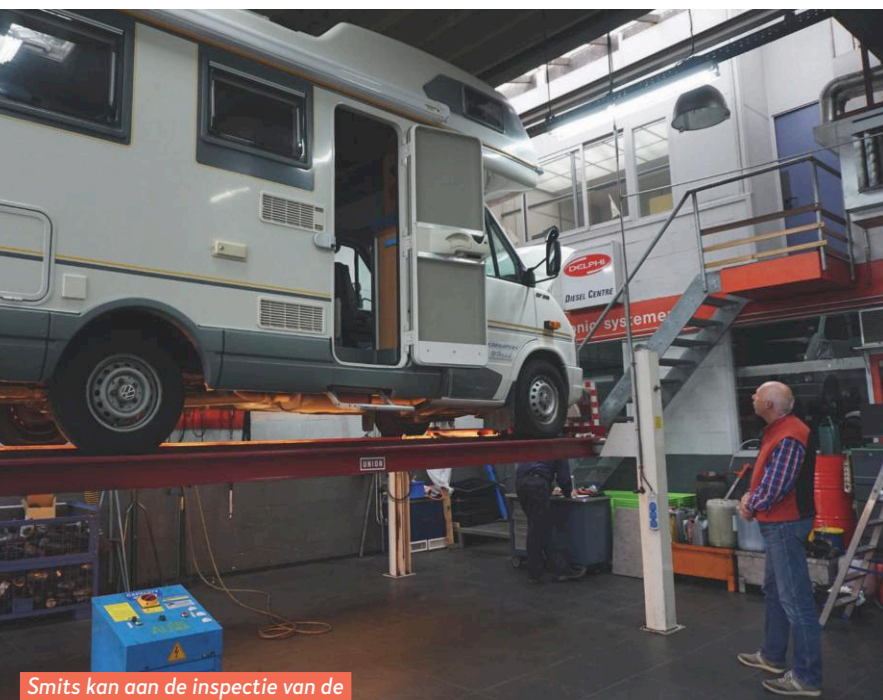
Smits kan aan de inspectie van de onderzijde beginnen.