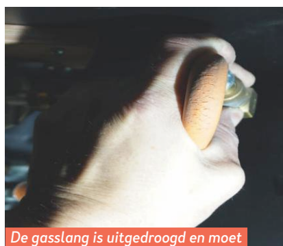
De gas slang is uitgedroogd en moet worden vervangen.

de airco volgens Kuiper nog steeds naar behoren.