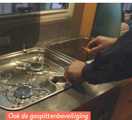
Ook de gaspittenbeveiliging blijkt naar behoren te werken.

nieuw. Alleen de spanning is wat aan de lage kant, maar dat is snel verholpen.