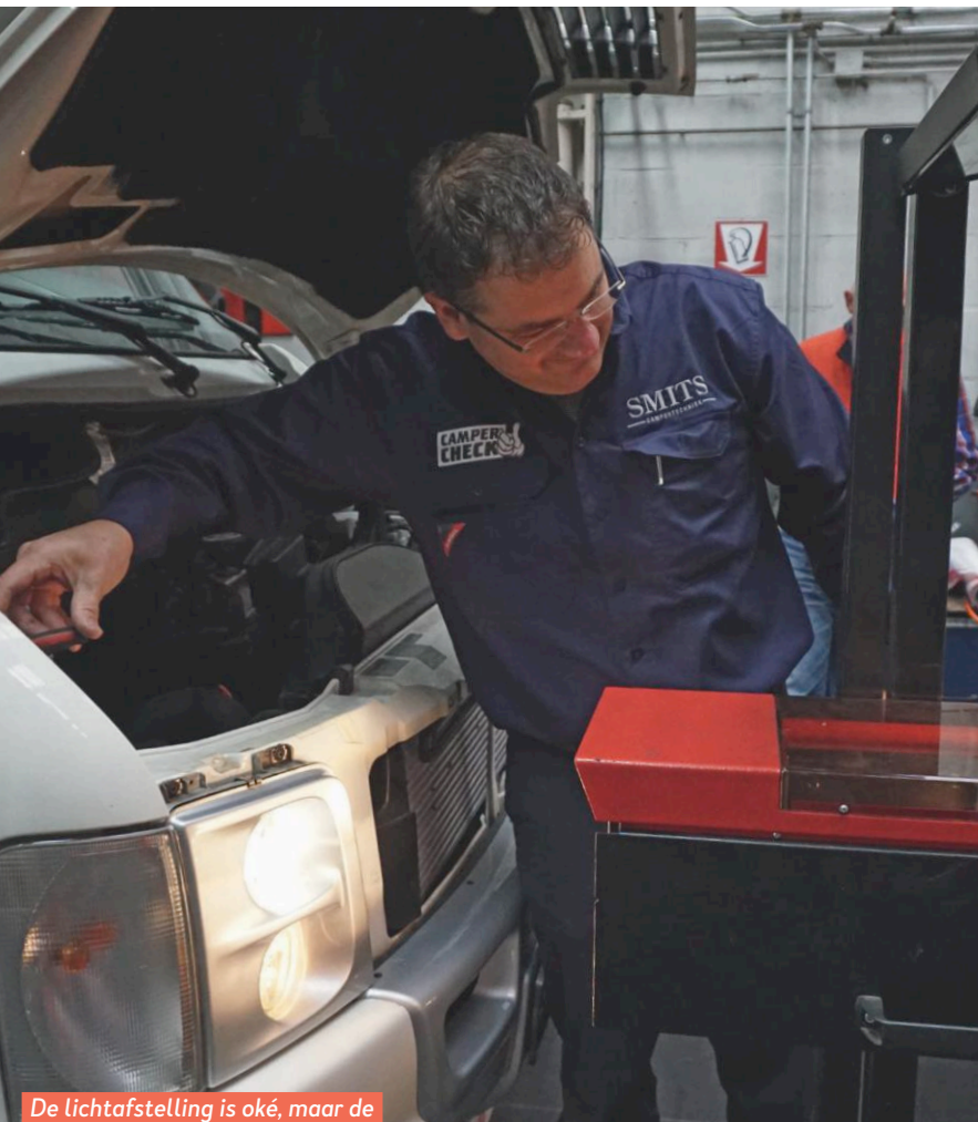
De lichtafstelling is oké, maar de hoogteregeling niet.