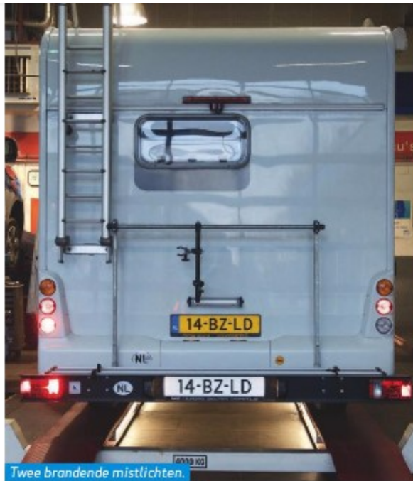
Twee brandende mistlichten. Dat mag niet van de wetgever.