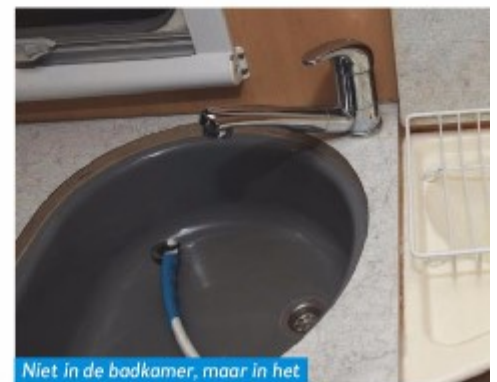
Niet in de badkamer, maar in het keukenblok: het wasbakje.