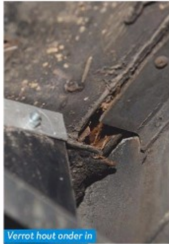
Verrot hout onder in de rechterzijwand.