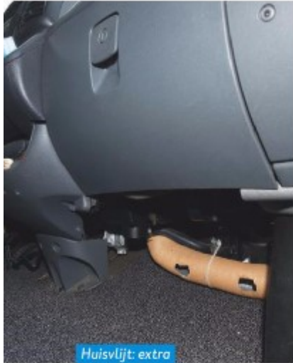
Huisvlj: extra voetverwarming.