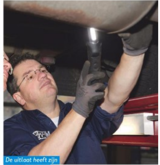
De uitlaat heeft zijn beste tijd gehad.

leek zou vrezden dat de hele zijwand er zo beroerd aan toe is. Maar Smits stelt gerust. Die wand bestaat uit isolatiemateriaal. Alleen de ingelijmde strook multiplex, bedoeld om onder meer de skirts aan te bevestigen, is verrot. "Zijskirts