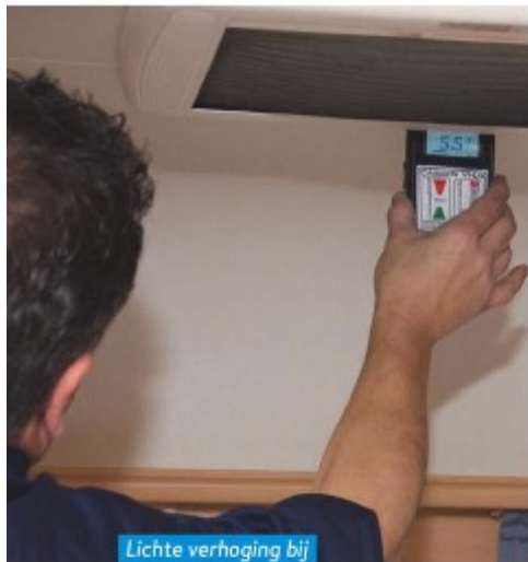
Lichte verhoging bij de vochtmeting.