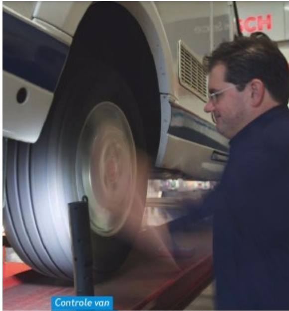
Controle van een wiellager.