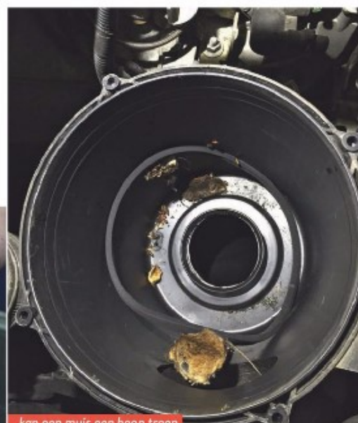
...kan een muis een hoop troep veroorzaken.