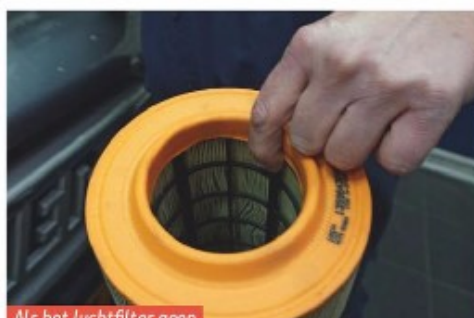
Als het luchtfilter geen metalen raster heeft...