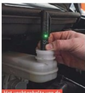
Het vochtgehalte van de remvloeistof is niet te hoog.