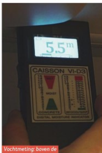
Vochtmeting: boven de kritische waarde van 5.