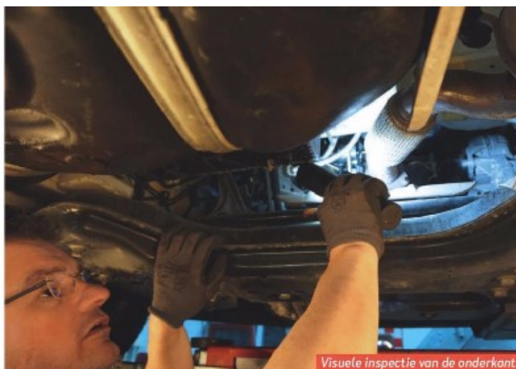
Visuele inspectie van de onderkant.