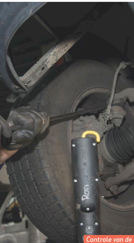
Controle van de voorwielophanging.