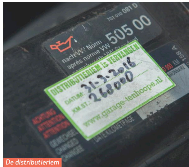
De distributieriem kan nog even mee.

die dingen vervangen. Zwaar verroest. Maar deze zijn gewoon keurig.” En nu de onderkant van de wagen in het licht van de brug en Smits’ looplamp toch onbarmhartig in beeld is, laat de keurmeester beruchte doorrotplekken zien van de T4. Wielkuipe, binnenranden van spatborden, chassisbalken. “Je komt ze wel jonger dan deze tegen waar zelfs niets meer aan te lassen valt. Zo katsuverrot.” Het verhaal wordt eentonig: