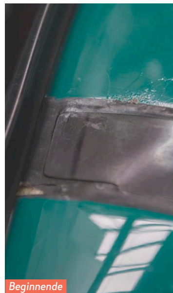
Beginnende roest op het dak.