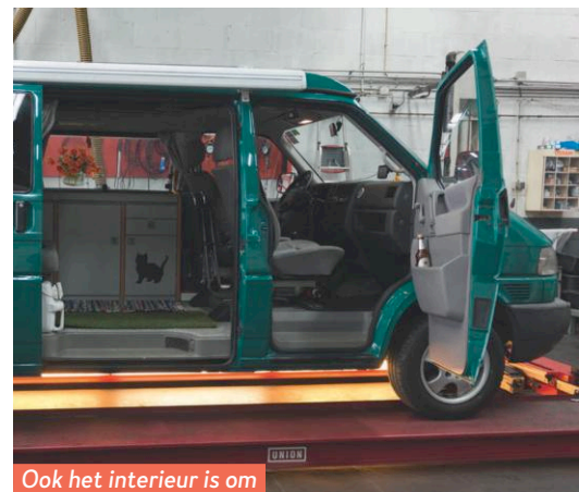
Ook het interieur is om door een ringetje te halen.

Smits, omdat de banden nog vrij jong zijn en nog maar geringe slijtage vertonen. Erg veel kwaad kan dat cuppen op de achteras niet, maar de kenner hoort de banden nadrukkelijk afrollen. En nog een wielsingetje: het reservewiel is net zo oud als de VW zelf. Twintig jaar dus. Dat is voor de band ver over de houdbaarheidsdatum en de velg is zo zwaar verroest, dat Smits algehele vervanging aanbeveelt.