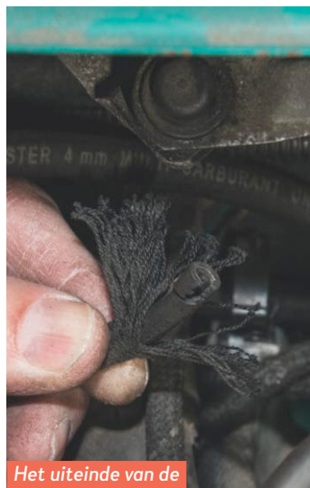
Het uiteinde van de vacuümslang is rafelig.