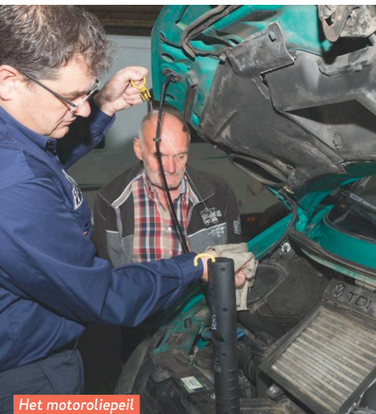
Het motoroliepeil staat te hoog.