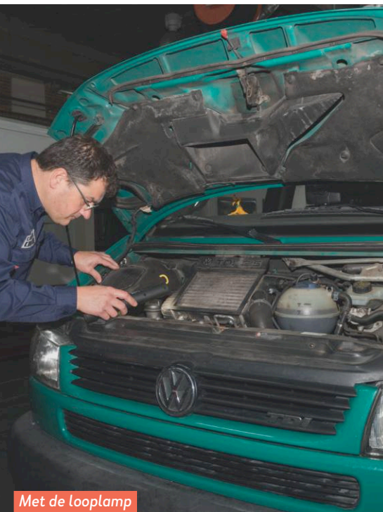
Met de looplamp op zoek naar mankementen.