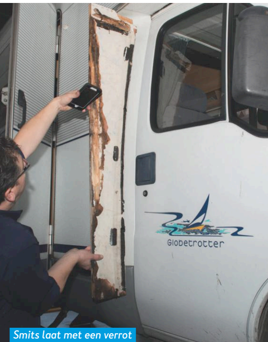
Smits laat met een verrot paneel van een identieke camper zien wat vocht kan doen.