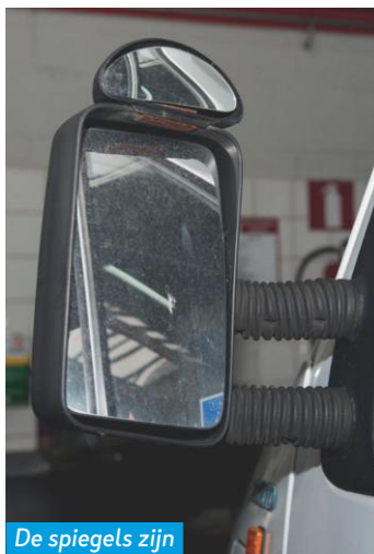
De spiegels zijn volgens Smits een ramp.