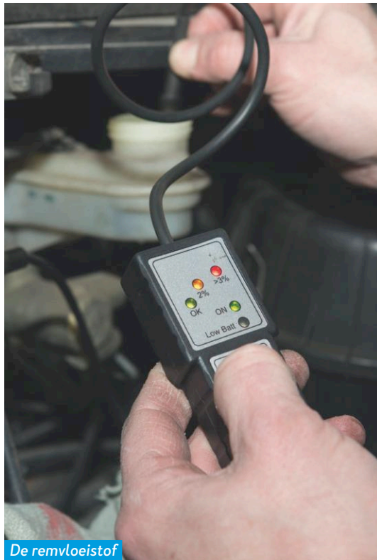
De remvloeistof bevat te veel vocht.