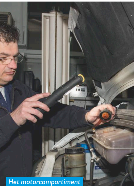
Het motorcompartiment oogt fris en de motor is droog.