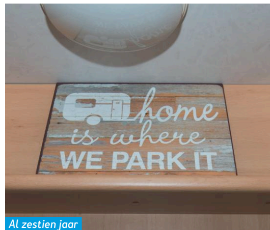
Al zestien jaar het mobiele huisje.